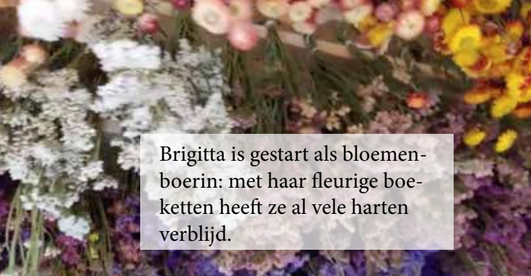
Brigitta is gestart als bloemenboerin: met haar fleurige boeketten heeft ze al vele harten verblijd.