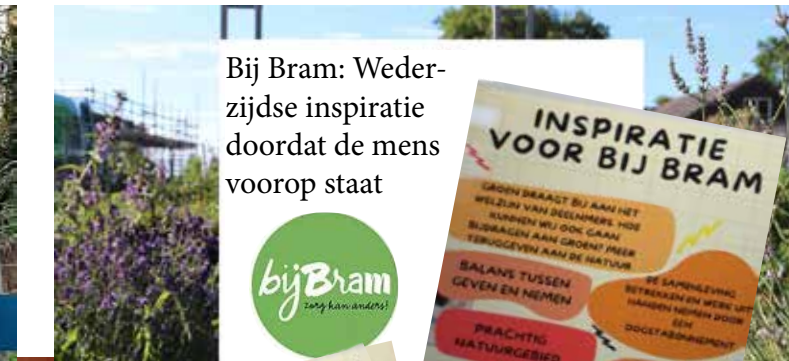
Bij Bram: Wederzijdse inspiratie doordat de mens voorop staat