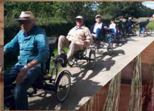
Op pad met de ouderen van de Pereboom, op zoek naar kruiden en wildpluk om in bosjes te drogen op de zolder.