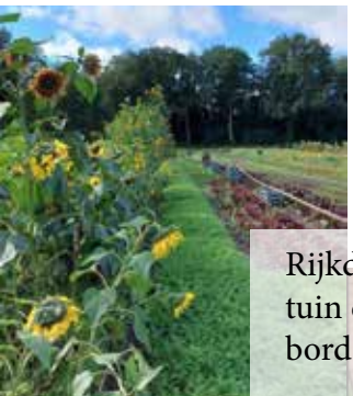
Rijkdom ontstaat in de oogsttuin en elke dag weer op ons bord bij de lunch!